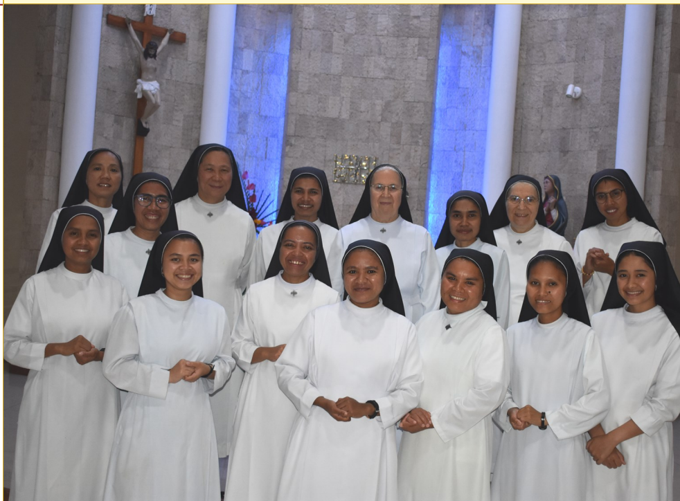
Neoprofesse e comunità di Ruteng