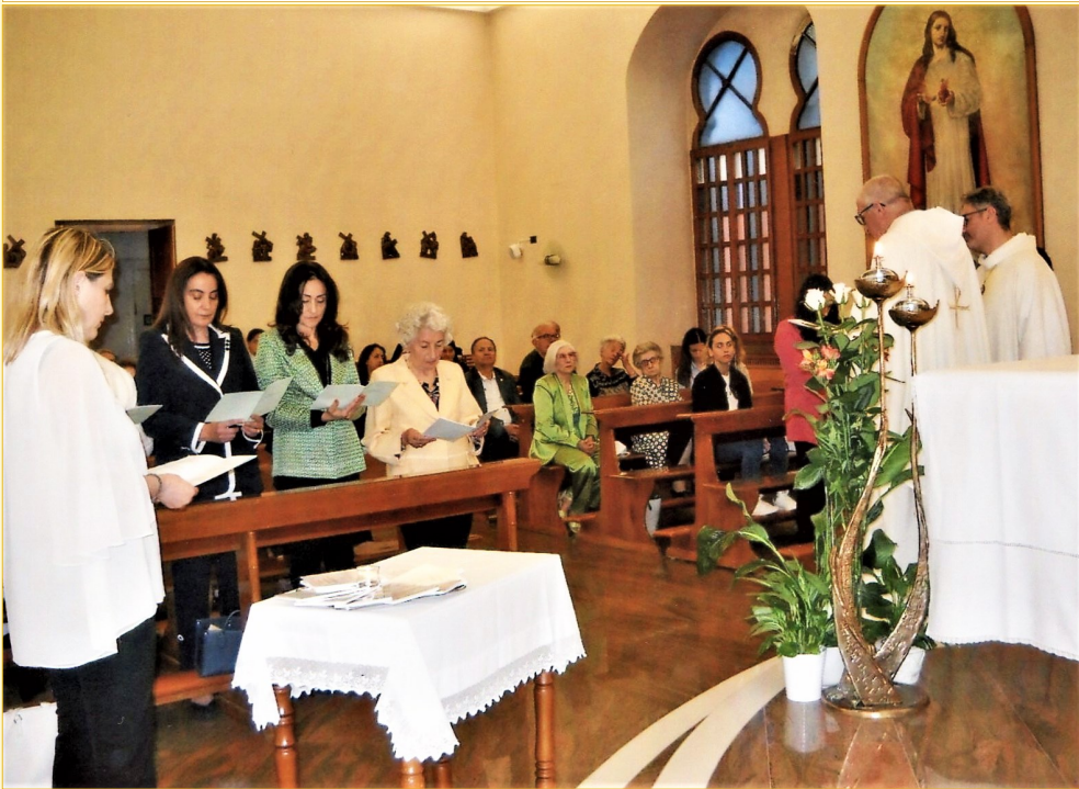
(A sinistra) Le candidate in un momento del Rito.

Le vostre azioni hanno illuminato il nostro cammino e ci hanno