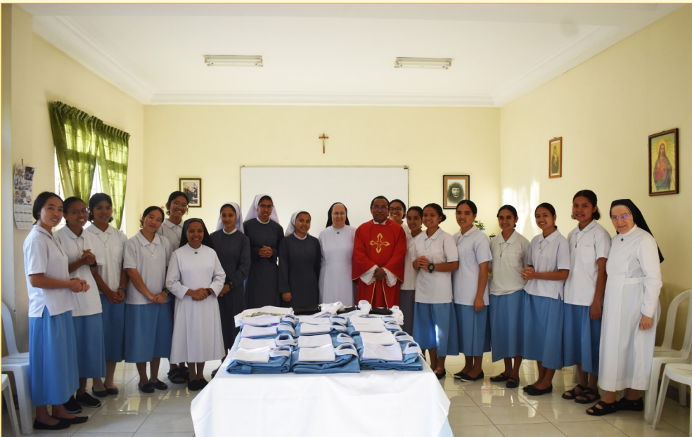
Benedizione di abiti per Novizie e Professande.

A proposito, nel piccolo contesto di ogni Comunità, ciascuna Sorella offre il proprio servizio per essere vicina a questi fratelli