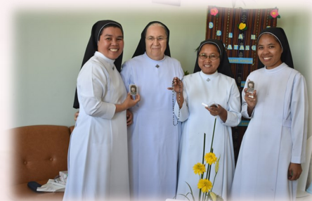
Comunità di Ngkor