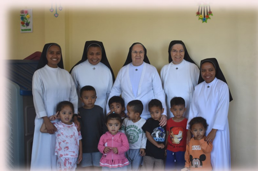
Nido di Ruteng