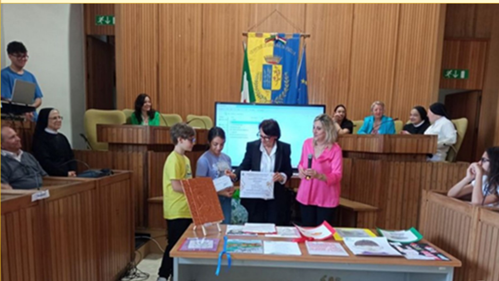
Momento della premiazione.

"Fautore caldissimo dell'Istruzione e della Scuola" , come amava definirsi, in un tempo in cui il problema dell'istruzione non era sentito né dalla classe dominante né da quella