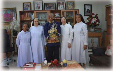
DEPOK: Incontro con il Vescovo