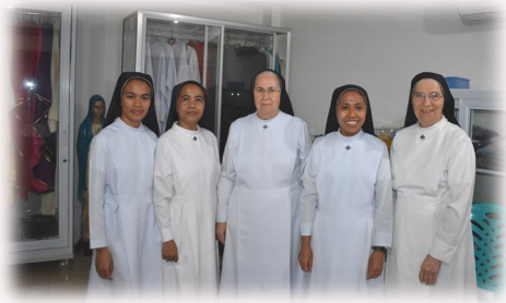
Negozio parrocchiale di paramenti sacri