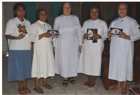
Comunità di Kupang