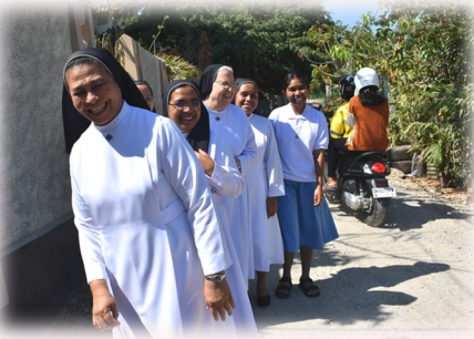
A Messa in primissima mattina