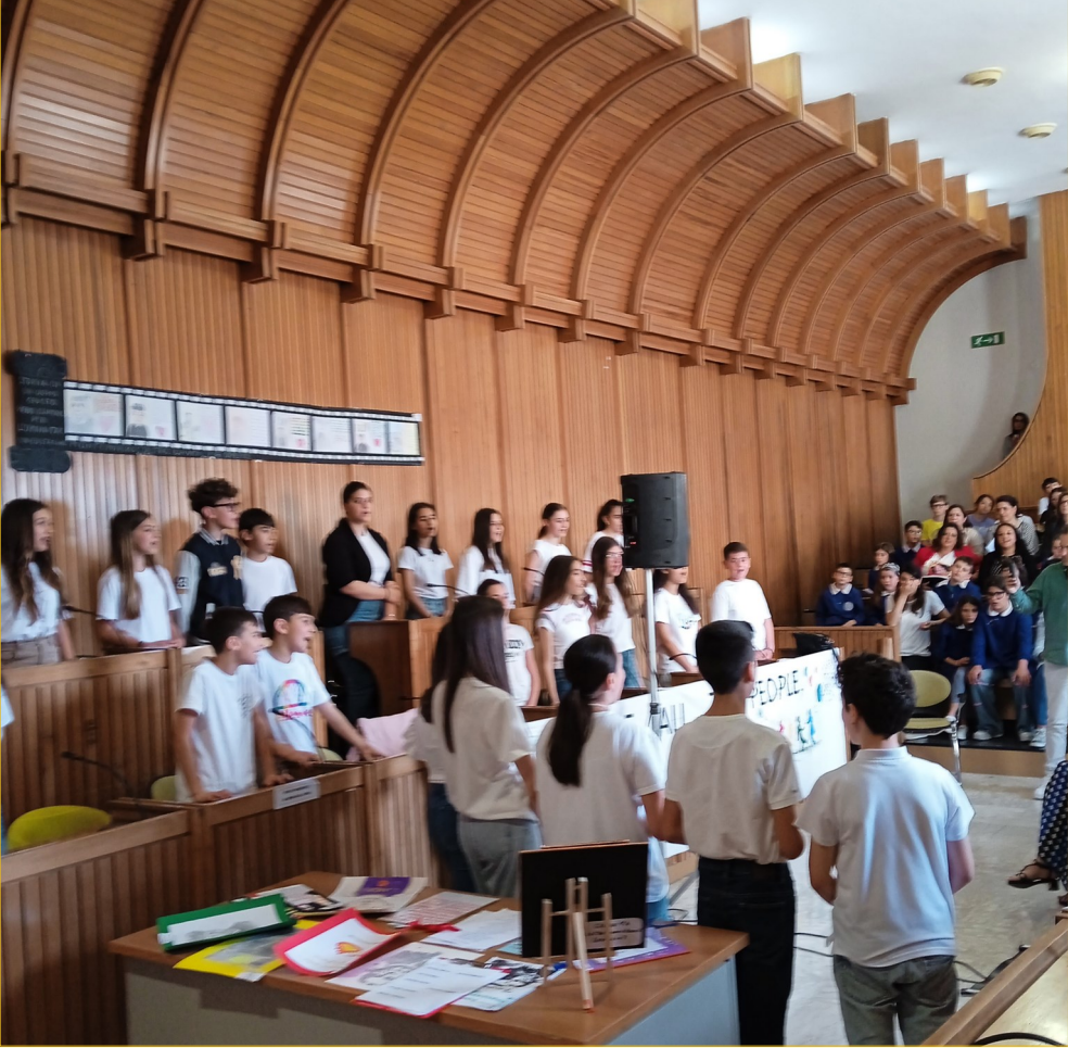
Gi alunni dell'I.C. "Eustachio Montemurro", mentre si esibiscono nel canto finale.

subalterna, e dominava l'analfabetismo, fu un sostenitore convinto dell'importanza dell'istruzione e della scuola come istituzione pubblica per la formazione dei futuri cittadini.