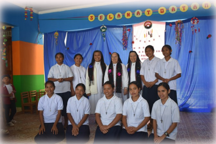
Arrivo a Ngkor